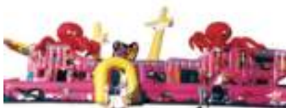
GRAND GALION GONFLABLE