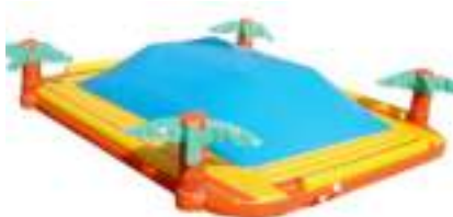
SUPER DUNE GONFLABLE