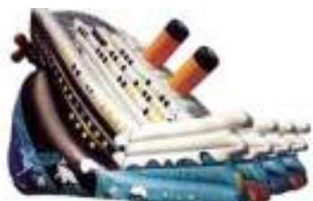
TOBOGGAN TITANIC GONFLABLE