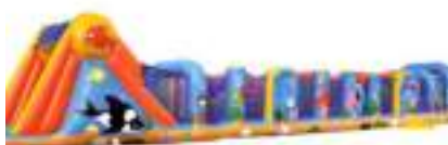
OCEAN GEANT GONFLABLE