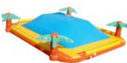
SUPER DUNE GONFLABLE