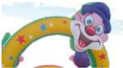
JOYEUX CIRQUE GONFLABLE