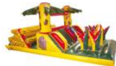
PARCOURS JUNGLE GONFLABLE