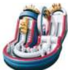
ROLLER COASTER GONFLABLE