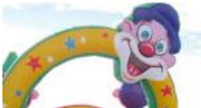
JOYEUX CIRQUE GONFLABLE