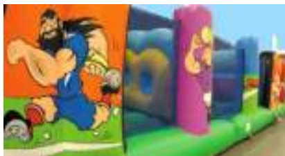
TERRAIN RUGBY GONFLABLE : le Parcours Pack Plaquage !