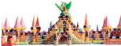
DONJONS DRAGONS GONFLABLE