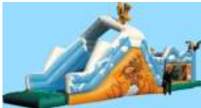
POLE BANQUISE GONFLABLE