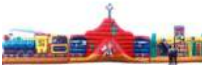
GRAND CANYON GONFLABLE

Published on Monica Médias ( https://www.monicamedias.com )