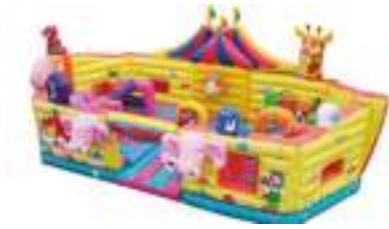
LE ZOO DU CIRQUE GONFLABLE