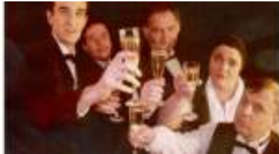
Faux Serveurs : la folle soirée des PIQUE-ASSIETTES