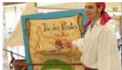
LE TRESOR DU PIRATE : chariot spectacle pour jeux d'aventure