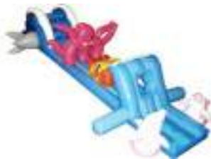
PARCOURS AQUATIQUE AVEC DAUPHINS