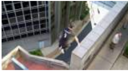
Le Parkour : l'art de se déplacer sans laisser de trace!