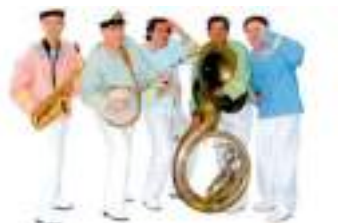
MARINS JAZZY MOUSSES