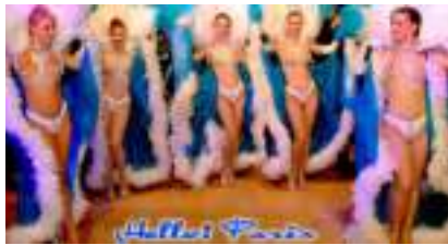
Soirée Spectacle Cabaret : Hello Paris French Cancan