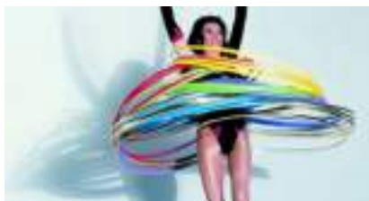
HULA LA TRISA : le Hulla-hop fait son cirque