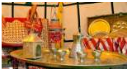
DECO SOIREE ORIENTALE 5