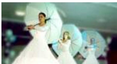
LA COMPAGNIE DU SWING