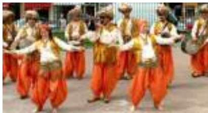
SIYARA : orchestre oriental d'Arabie