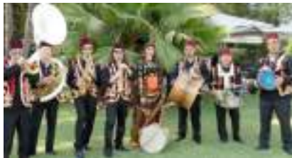
FANFARE RAÏ AL MAGHRIB