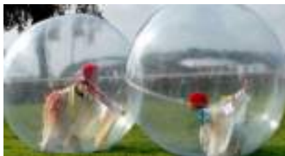
Danseurs et jongleurs en sphères : LE BALLET A BULLES