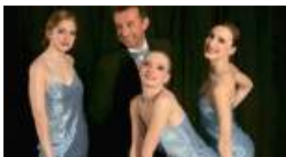
JAZZ ET CLAQUETTES