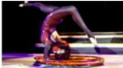
MISS HULA HOOP : cerceaux pour danse orientale ou sixties