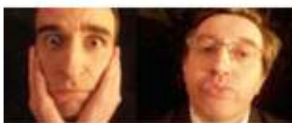
Faux serveurs comiques : le staff des PIQUE-ASSIETTES