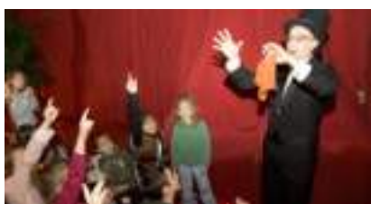
MAGICIEN CLOSE UP HAUT DE FORME