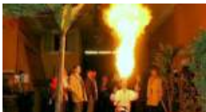
LE FAKIR MAGICIEN CRACHEUR DE FEU : jamais mal !