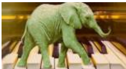
HISTOIRES DE BABAR : le Roi des Eléphants