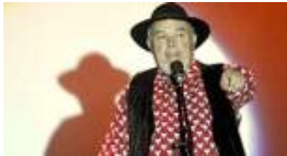
LES LETTRES DE MON MOULIN: la Provence de Daudet