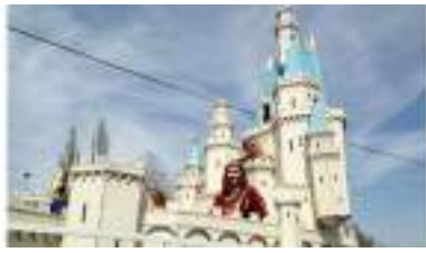
le CHAR DU CHATEAU de la Belle au Bois Dormant