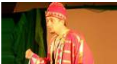
CONTES D'AFANASSIEV : merveilleuses histoires russes