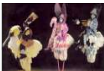
DRÔLES D'OISEAUX ECHASSIERS : vol d'artistes poids-plume