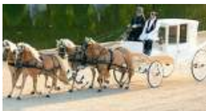
ATTELAGES DE CHEVAUX