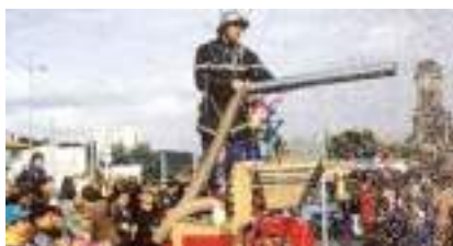
CHAR DES POMPIERS CONFETTIS