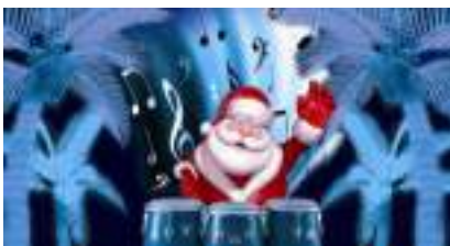
SPECTACLE de NOEL Musical Familial et Féérique : CIRCUS BONGO PARADE !