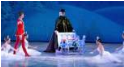
CASSE-NOISETTE : le ballet féérique