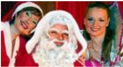
LA LEGENDE DU PERE NOEL