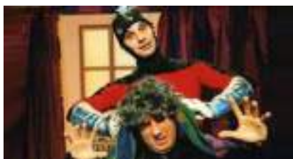
M GROGNEUX ET L'AUTOMATE