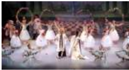
LA BELLE AU BOIS DORMANT: musique de Tchaïkovski conte de Perrault et Grimm