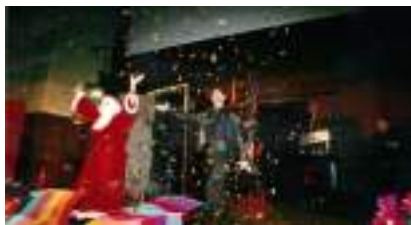
Spectacle de Magie pour Arbre de Noël : MARC LE MAGICIEN INTENSE