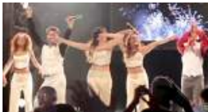
SOIREE DISCO FUNKY HITS