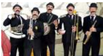
L'Orchestre Rétro de la Belle Epoque et des Années Folles 1900-1920