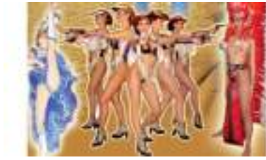
SOIREE SPECTACLE FAR WEST : CANCAN WESTERN