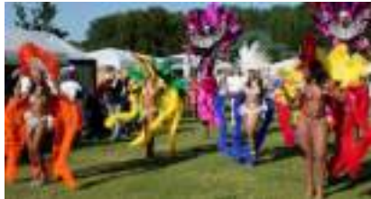
CARNAVAL RIO SHOW