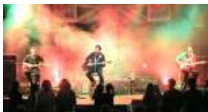
NEW STONES: Orchestre Tribute to the Rolling Rock