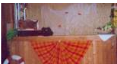
DECO BRESIL 2