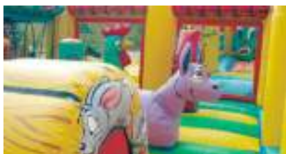
LA GRANGE PARTY GONFLABLE