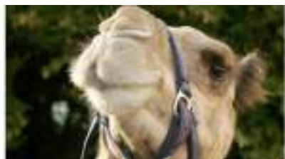
CHAMEAUX ET DROMADAIRES