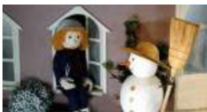
LE JARDIN DES SAISONS

Source URL: https://www.monicamedias.com/node/515