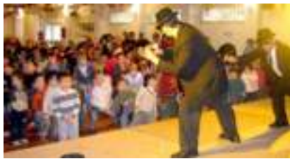
Orchestre BLUESMEN DE NOEL : Papa Noel est rockeur