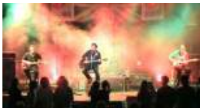
NEW STONES: Orchestre Tribute to the Rolling Rock