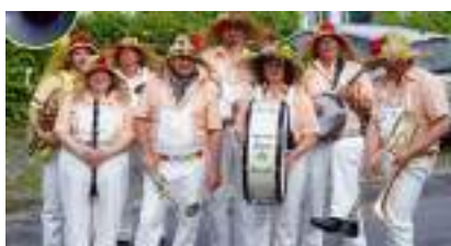
LES JARDINIERS : Orchestre Champêtre Bio Printanier au Swing Vert et Fleuri