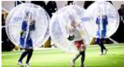
Football en Bulles : des Bubbles, des Ballons et des Buts