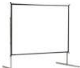
ECRAN CADRE 4 M X 3