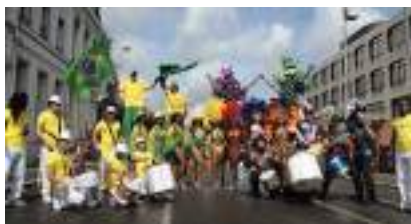
LES SUPPORTERS BRESILIENS : Echasses Capoeïra et Samba Dance