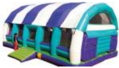
ELASTIQUE FOOT GONFLABLE