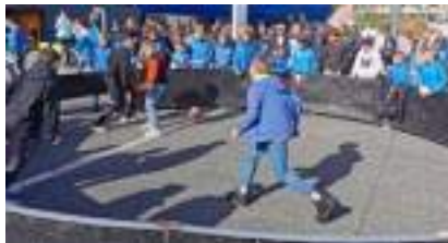
Avant Match Foot Coupe du Monde : on Chauffe la Fan-Zone !