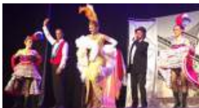
Spectacle Séniors : Le French CanCan en Comédie Musicale "LAURE DE PANAME"

Source URL: https://www.monicamedias.com/soiree-cabaret-paris-champs-elysees.html