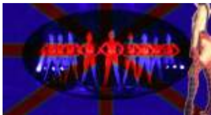
Soirée Cabaret Spectacle : Revue Paradise Paris