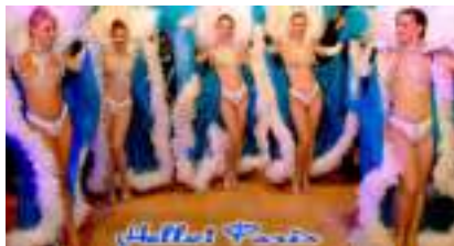
Soirée Spectacle Cabaret : Hello Paris French Cancan