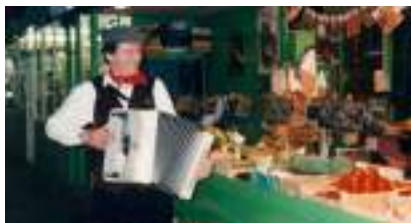
ACCORDEONISTE MUSETTE : Chansons Françaises Rétro Valses pour Bal à l'Ancienne