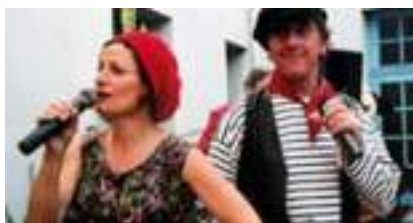
ORCHESTRE MUSETTE : le Groupe Guinguette de l'Accordéon en Chansons