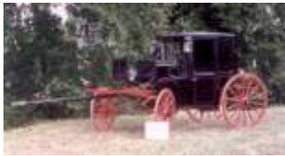
VOITURE COUPE DE VILLE 1900 AVEC ATTELAGE