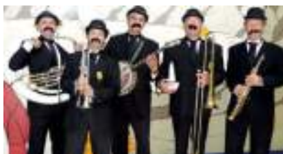
L'Orchestre Rétro de la Belle Epoque et des Années Folles 1900-1920