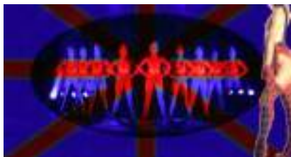
Soirée Cabaret Spectacle : Revue Paradise Paris