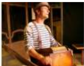
ORGUE de BARBARIE en spectacle : acteur et musicien de rue