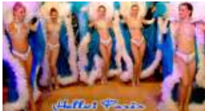
Soirée Spectacle Cabaret : Hello Paris French Cancan