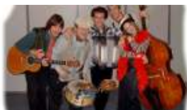
Orchestre Guinguette Musette Jazz Chansons Françaises : LES TITIS PARISIENS