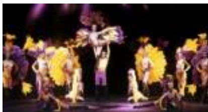
Soirée Cabaret Paradise : le Music Hall des 5 Continents