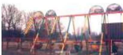
Balançoires à l'Ancienne de Parc Années 1930/1940