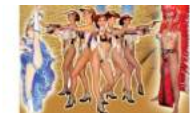
SOIREE SPECTACLE FAR WEST : CANCAN WESTERN