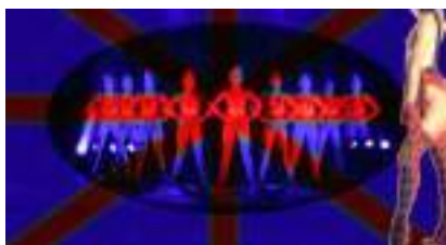
Soirée Cabaret Spectacle : Revue Paradise Paris