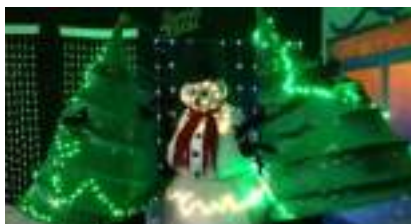
Le BONHOMME de NEIGE GEANT, ses SAPINS de NOEL et leurs Faits d'Hiver !