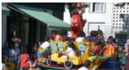
MANEGE ECOLO clown voitures et animaux