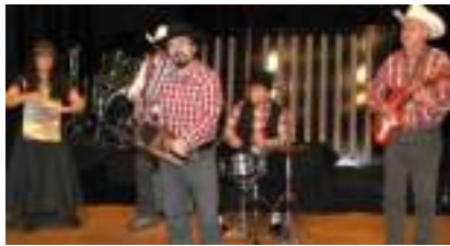
ORCHESTRE COUNTRY CAJUN: soirée LOUISIANE TEXAS