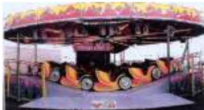
Le Manège CHENILLE 1939 ou Music Express, Star de la Fête Foraine...