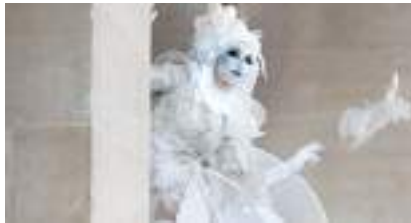
LES ECHASSIERS FLEURS BLANCHES LUMINEUSES : pour Maman, pour Noël et par Amour