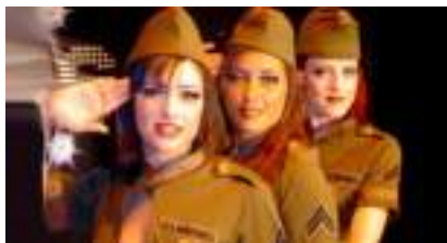
LA CITE DES ANGES : COMEDIE MUSICALE EN DIRECT