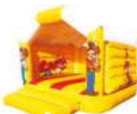
FAR WEST GONFLABLE