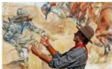
LE DUEL DE L'OUEST AUX LASSOS ET REVOLVERS