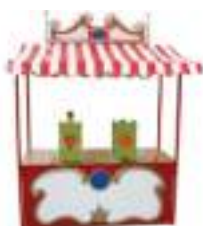
BATAILLE DE NOUGATS