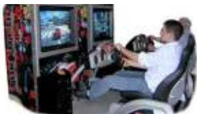
SIMULATEUR de CONDUITE TOKYO COP