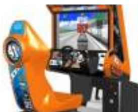
SIMULATEUR de RALLYE AUTO : DAYTONA De Luxe!

Source URL: https://www.monicamedias.com/simulateur-snowboard-le-surf-des-neiges-jeu-d-arcade-x-games.html