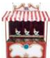
STAND TIR AU POULAILLER FORAIN