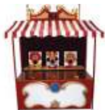
BOUFFE BALLES FORAIN