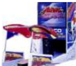
SIMULATEUR SURF DES NEIGES ALPINE SURFER SNOWBOARD