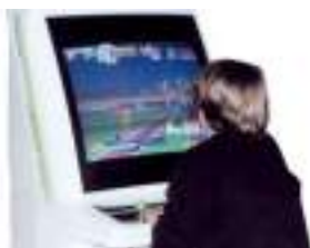
CONSOLES DE JEUX