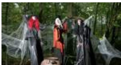
HALLOWEEN SUR ECHASSES: les sorcières en ont dans la citrouille