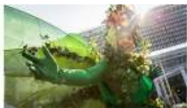
LES FEES DU PRINTEMPS : Echassiers de Rêve en Vert Nature