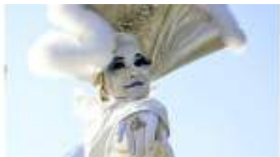
LES ECHASSIERS ANGES BLANCS entre Ombres et Lumières