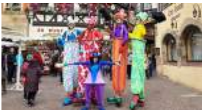
MAXI CLOWNS ECHASSIERS : gags géants et bulles musicales