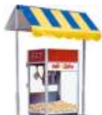
STAND POP-CORN 3