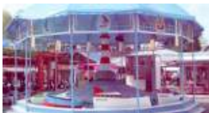
Manège des Petits Bateaux, du Phare et P'tits Mousses qui vont sur l'Eau...