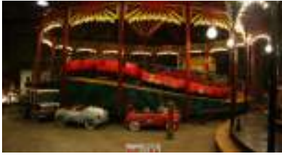
Le grand Manège de la Chenille chinoise de 1940