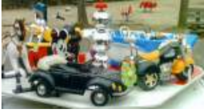
PETIT MANEGE ECOLO