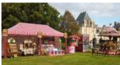
PETITE FETE FORAINE de LUXE avec Carrousel, Stands, Orgue et Gonflable...