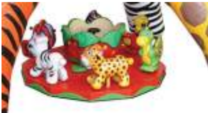
MANEGE GONFLABLE des ENFANTS de la JUNGLE