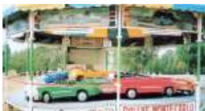
Manège de Bolides pour Enfants : Rallye Auto de Monte-Carlo version Petites Voitures de Collection !