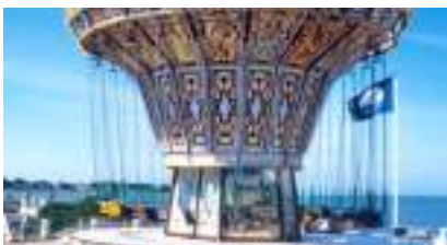
Manège Voltigeur Pousse-Pousse ou Carrousel à Chaînes authentique 1930