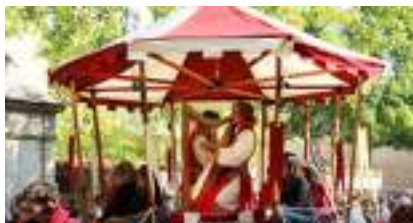
MANÈGE ECOLO MUSICAL MEDIEVAL DE FER FORGE