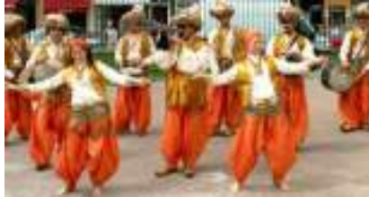
SIYARA : orchestre oriental d'Arabie