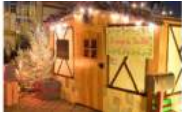
LA MAISON DU PERE NOEL