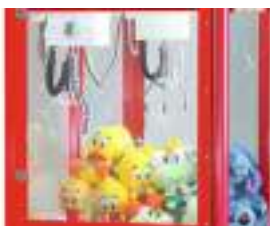
LOCATION GRUE FORAINE : Machine à Peluches et Cadeaux à Gogo !