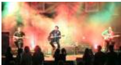
NEW STONES: Orchestre Tribute to the Rolling Rock