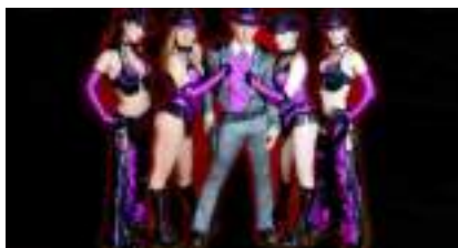
SHOW WESTERN WILD WEST et ses Mystères