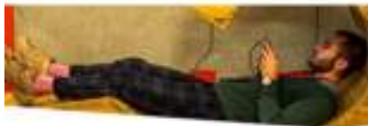
JEUX VIDEO FOOT en Location Eynementielle : la Coupe du Monde des Consoles !