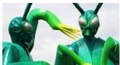
LES INSECTES LUMINEUX VERTS : Lucioles Géantes sur Echasses