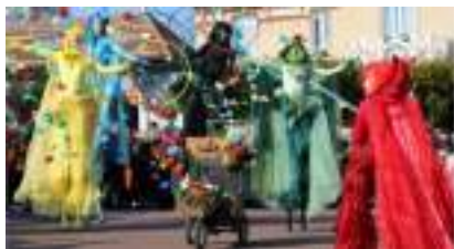
LES JEUX OLYMPIQUES sur ECHASSES : Déesses d'Athènes aux Anneaux à la Mode Parisienne J.O. 2024 !