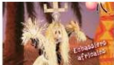
ECHASSIER-SORCIER et DJEMBE : l'Afrique au Sommet