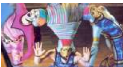
LES ECHASSIERS HIGH-TECH : le futur à pas de géants