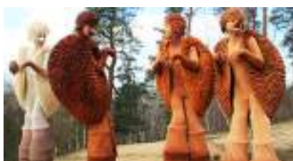
Les ECHASSIERS HERISSONS : Humour Piquant