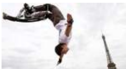
Echasses urbaines : un spectacle à faire des bonds de joie !