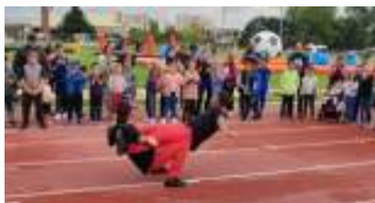
Village des SPORTS OLYMPIQUES : Location de Parc Multisport pour Animation Initiation Démonstration !