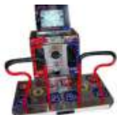
LOCATION MACHINE A DANSER D.D.R.