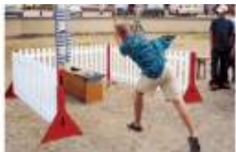
MAILLOCHE FORAINE : le Jeu à la Masse !