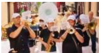
FANFARE BANDA de la FERIA BASQUE : l'Orchestre de Fiesta Mobile SPORTS RUGBY