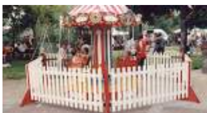
LE PETIT MANEGE DES CHAISES VOLANTES FORAINES