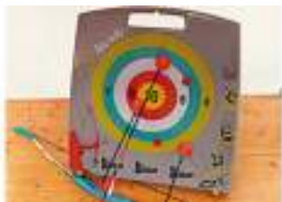
STAND FORAIN TIR A L'ARC