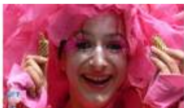
Les Echassiers Sucrés Gourmands : LA FAMILLE BONBONS!