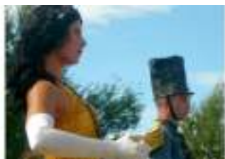
LE SOLDAT DE PLOMB ET LA DANSEUSE: maxi jouets pour conte sur échasses