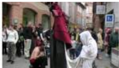
ECHASSIERS JONGLEURS CRACHEURS : la Troupe de l'Illustre Spectacle de Rue