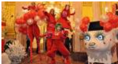
LES ECHASSIERS LUTINS ROUGES : la Fête Contemporaine Arty et Design