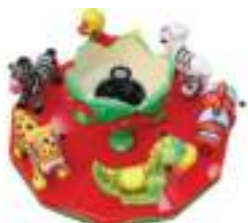
MANEGE PETITS ANIMAUX