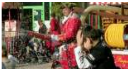
CANON CONFETTIS PIRATES Char Pompiers