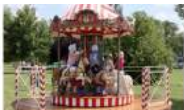
Petit CARROUSEL ancien des CHEVAUX de BOIS