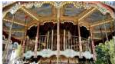
CARROUSEL DOUBLE ÉTAGE en Location