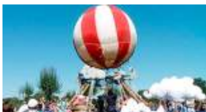
Le Manège Ecolo Musical du TOUR DU MONDE en BALLON