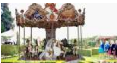
MANEGE CARROUSEL Molière : les Chevaux de Bois à louer comme à la Parade du Roi Soleil !