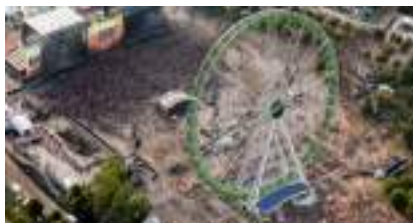
GRANDE ROUE PANORAMIQUE ECOLO 55 Mètres en Location : la Star de votre Événement-Ciel !