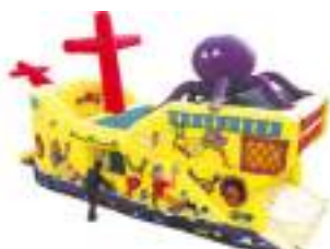
BATEAU PIRATE GONFLABLE