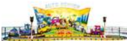
MANEGE AUTO BABY