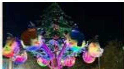
MANEGE du GRAND SAPIN DE NOEL en Location