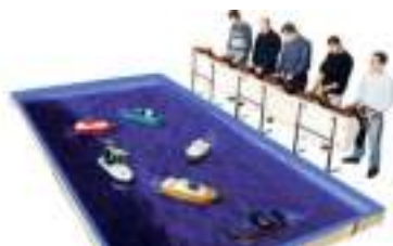
BASSIN pour BATEAUX RADIOCOMMANDES