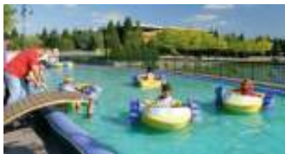
BASSIN GONFLABLE pour petits PEDALOS "paddler"