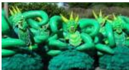
LA PARADE DES PIEUVRES GEANTES The Octopus Ballet