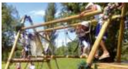
PARCOURS TRIPODE TYROLIENNE : l'Aventure Forestière Aérienne