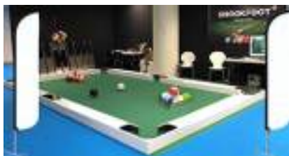
SNOOKBALL en location : le FOOTBALL comme sur un BILLARD, c'est SNOOKFOOT !