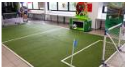
TIR AU BUT FOOTBALL KICKER ELECTRONIQUE