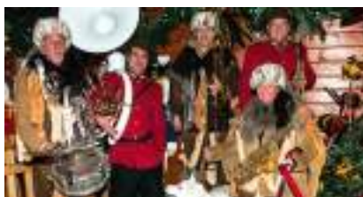
Orchestre du Grand Nord canadien LES TRAPPEURS