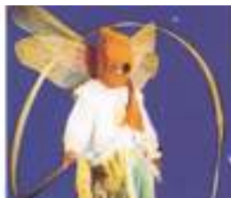
INSECTES GEANTS ECHASSIERS: ailes de lumières