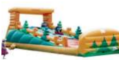
PISTE DE LUGE GONFLABLE