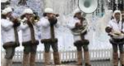
L'Orchestre du Grand Noël en Blanc : Musiciens ESQUIMAUX GROENLAND POLE NORD