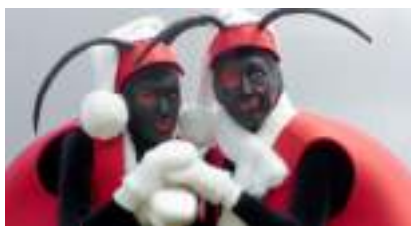
LES COCCINELLES GEANTES : Echassiers en Rouge et Noir !