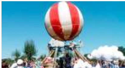
Le Manège Ecolo Musical du TOUR DU MONDE en BALLON