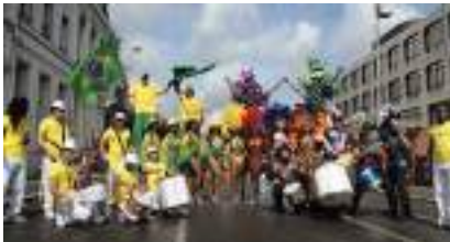
LES SUPPORTERS BRESILIENS : Echasses Capoeïra et Samba Dance