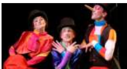
DETECTIVES SUR ECHASSES : les inspecteurs musiciens ont du nez