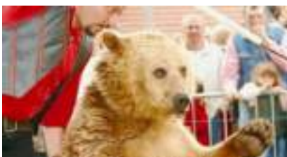
LA GRANDE OURSE 2 : Dressage Ours