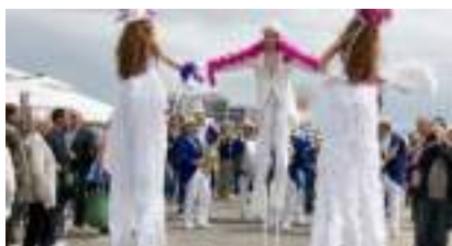
ECHASSIERS CABARET ANNEES FOLLES ET DANDY BELLE EPOQUE