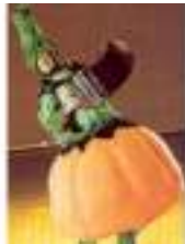
POTIRON-ORCHESTRE ET ACCORDEON