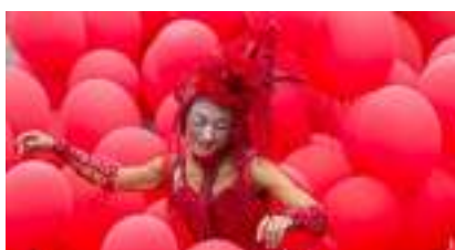
BELLES ECHASSIERES AUX BALLONS ROUGES ( MAUVES-PRUNE, JAUNES ou VERTS )