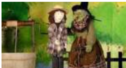
LA FERME ENSORCELEE: animaux ombres et magie