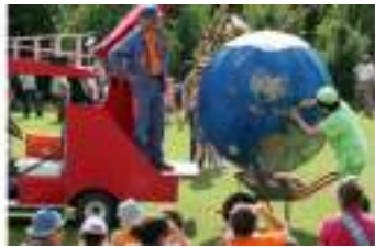
POINT D'EAU Planète Terre