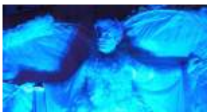
LES ECHASSES DU CIEL: anges en bleu et blanc