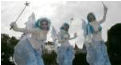
LES FEES AILEES SUR ECHASSES: magie menée à la baguette