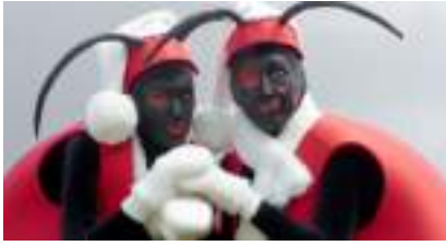
LES COCCINELLES GEANTES : Echassiers en Rouge et Noir !