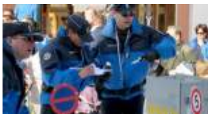
LES VRAIS FAUX GENDARMES