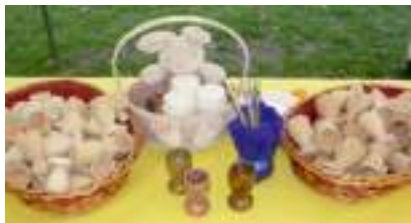
ATELIER LAPINS ET OEUF DE PÂQUES