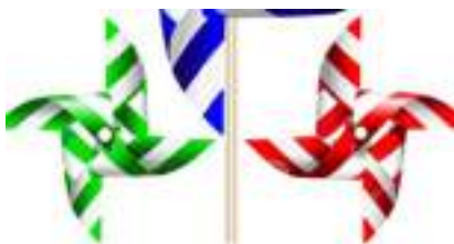
ATELIER MOULINS A VENT TRICOLORES