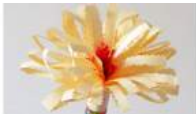
ATELIER CREATION DE FLEURS TRICOLORES EN PERLES PLUMES OU PAPIER CREPON