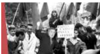
STUDIO PHOTO MAI 68 QUARTIER LATIN BARRICADES PARIS REVOLUTION