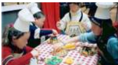
LA PETITE FABRIQUE : initiation petite enfance à la Création Manuelle