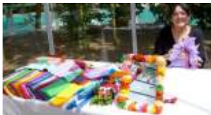
ATELIERS A FLEURS : Colliers Parfumés Ballon Crépon Légo