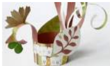
ATELIER LAMPIONS TRICOLORES