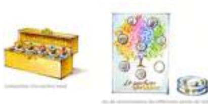
ATELIERS PARFUMES : fleurs odeurs senteurs