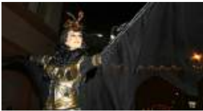
Les Femmes Félines sur Echasses : Fauvisme Fièvre de l'Or en Musique et Acrobatie