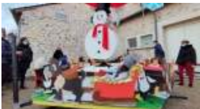
MANEGE de NOEL Ecologique à Traction Manuelle en Location