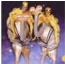
ECHASSES DE L'ESPACE : le futur sans plumes avec fiction