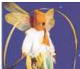
INSECTES GEANTS ECHASSIERS: ailes de lumières