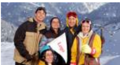
STUDIO PHOTO NEIGE SPORTS D'HIVER SKI MONTAGNE