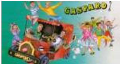
GASPARD ET SA GUIMBARDE : le cirque Formule 1