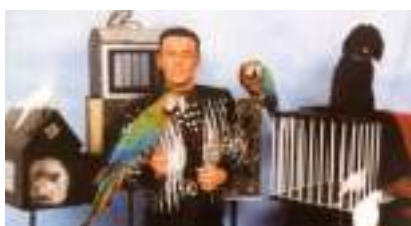
LE CIRQUE DES ANIMAUX