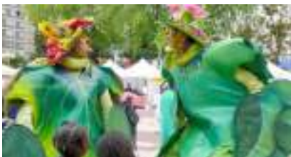
ECHASSIERS VERTS ENCHANTES : accueil écolo-clown oxygéné