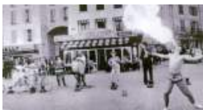
Cirque à vélo et monocycle : LES CYCLOWNS