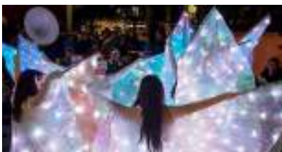
PARADE DE FETE FORAINE Lumineuse Musicale et Spectaculaire