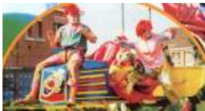
CHAR TURBO CLOWN : moteur musical pour carnaval