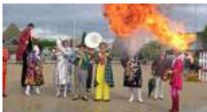
C'EST LA PARADE DU CIRQUE ! Jongleur Cracheur Clown et Monsieur Loyal...