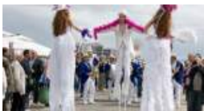
ECHASSIERS CABARET ANNEES FOLLES ET DANDY BELLE EPOQUE