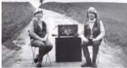
ORGUE 2 BARBARIE : Duo d'Amour pour animation 2 rue