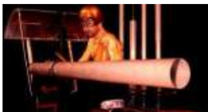
LA CYBERIENNE : le futur en musique et en tricycle