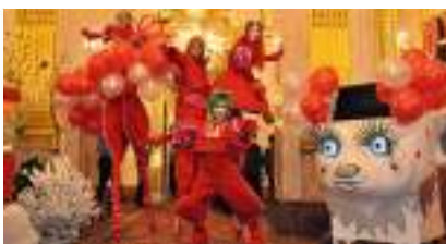
LES ECHASSIERS LUTINS ROUGES : la Fête Contemporaine Arty et Design