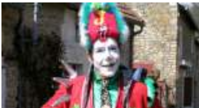
Le MIME CLOWN et sa MARIONNETTE magique en triporteur musical