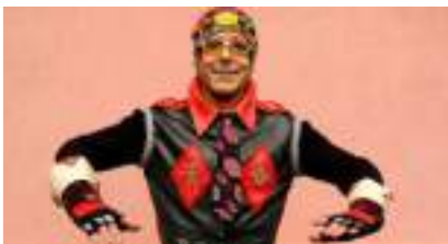
MIME SUIVEUR GAGMAN : pop art de rue