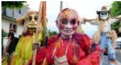
EPOUVANTAILS ECHASSIERS: effroyables jardiniers!