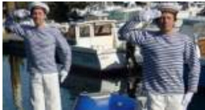
LES ECHASSIERS MARINS : géants des mers et des mares