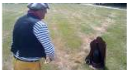
JEU DES ANNEAUX EN BOUTEILLE

Source URL: https://www.monicamedias.com/jeu-des-batonnets.html