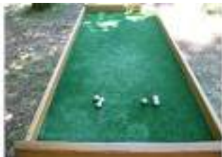
JEU DE LA PETANQUE SUR TABLE