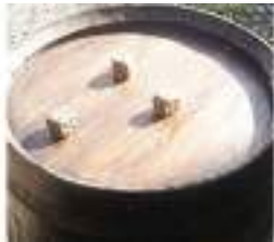
JEU de Dés 421 sur TONNEAU