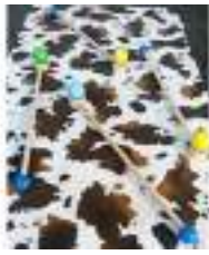
JEU DE LA COURSE A L'OEUF

Published on Monica Médias ( https://www.monicamedias.com )