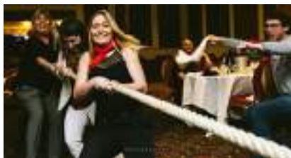
JEU DU TIR A LA CORDE