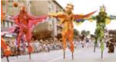
OISEAUX DANSEURS ECHASSIERS: Vol Rio Brésil Direct