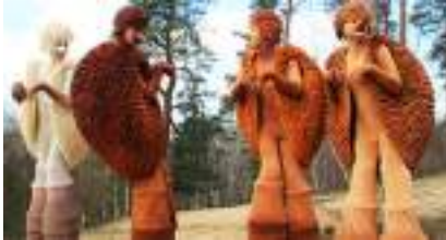
Les ECHASSIERS HERISSONS : Humour Piquant