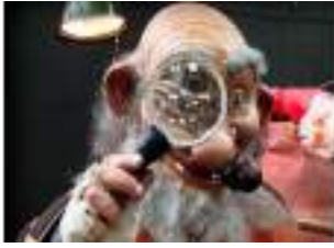
LES CHASSEURS DE FAUX PERES NOEL : Renne et Lutin Détectives