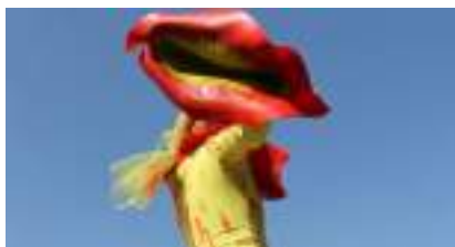
LES CREATURES DE LA JUNGLE