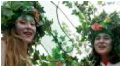
ECHASSIERS VERT NATURE: bio et belles plantes