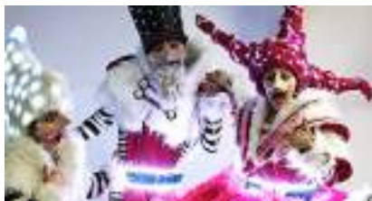
LES ECHASSIERS MUSICIENS blancs rouges du GRAND NORD SIBERIEN