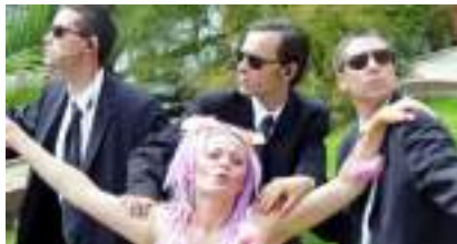
BODYGUARDS ECHASSIERS: agents de sécurité trop rapprochée