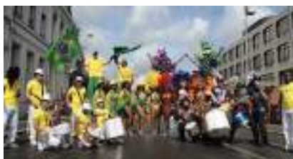
LES SUPPORTERS BRESILIENS : Echasses Capoeïra et Samba Dance