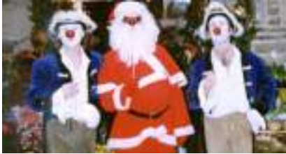
L'ARRIVEE OFFICIELLE DE NOEL