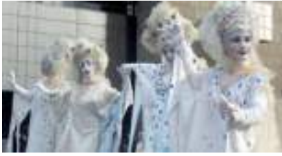
LES SAINTES DE GLACE : Echassières Féeriques de l'hiver