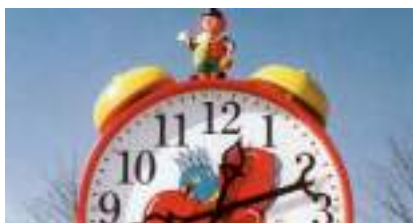
CHAR DU REVEIL EN FOLIE : lit-triple turbo