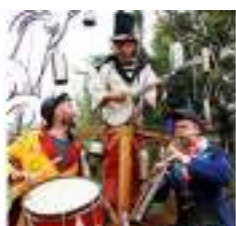
L'ARBRE MUSICAL : Concert de Vieilles Branches pour Jeune Conte