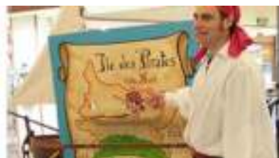
LE TRESOR DU PIRATE : chariot spectacle pour jeux d'aventure