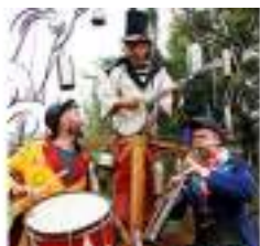
L'ARBRE MUSICAL : Concert de Vieilles Branches pour Jeune Conte