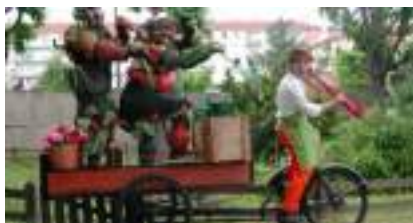
LE POTAGER DES GROSSES LEGUMES : les quatre saisons en triporteur