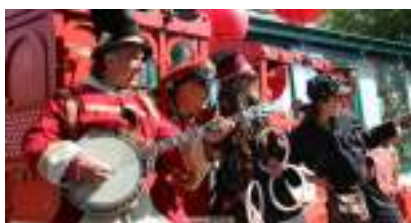
LA LOCOMOTIVE à MUSIQUE, SKETCHES ET BULLES : le Petit Train Rouge Rock West !

Source URL: https://www.monicamedias.com/mecanique-et-bulles-machine-infernale-sur-char-velo.html