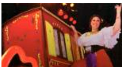
ROULOTTE ENCHANTEE et LIGNES de la MAIN : avec la Voyante gitane, le Cirque a une âme !