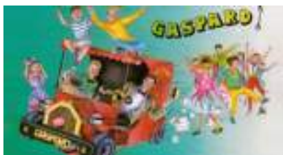
GASPARD ET SA GUIMBARDE : le cirque Formule 1