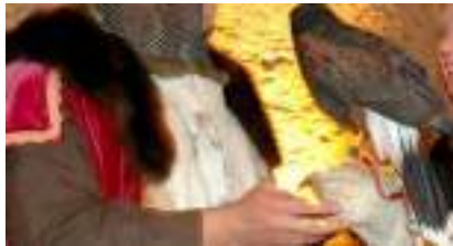
FAUCONNIER MAITRE DES RAPACES