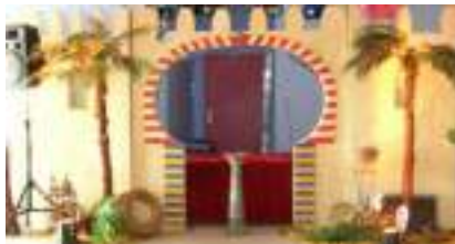
DECO SOIREE ORIENTALE 1