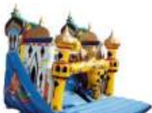
TOBOGGAN ORIENT MILLE ET UNE NUITS