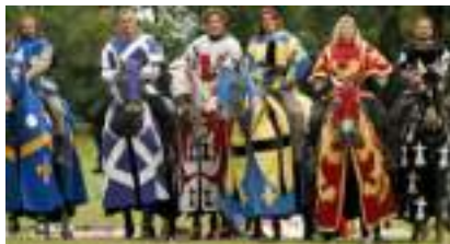
TOURNOI DES SEIGNEURS Joutes et Combats de la Chevalerie du Moyen Age