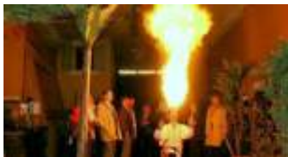
LE FAKIR MAGICIEN CRACHEUR DE FEU : jamais mal !