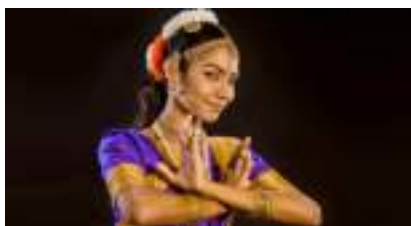
SOIREE BOLLYWOOD DANCE