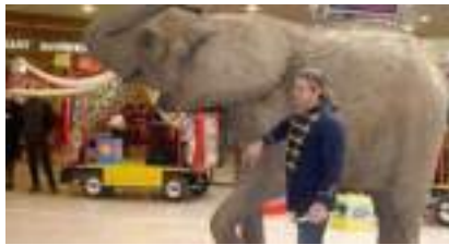
LE FAN D'ELEPHANT D'AFRIQUE