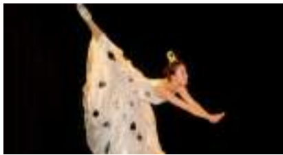
DANSE CLASSIQUE CHINOISE