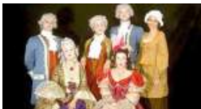
LES ARISTOCRATES : comtesses marquises et noblesse too-much