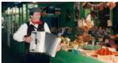
ACCORDEONISTE MUSETTE : Chansons Françaises Rétro Valses pour Bal à l'Ancienne