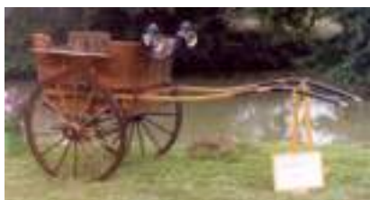
ATTELAGE TONNEAU 1905