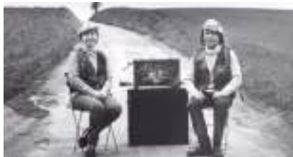
ORGUE 2 BARBARIE : Duo d'Amour pour animation 2 rue