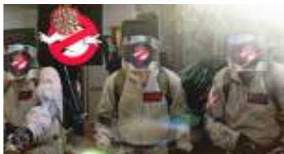
COVID-19 BUSTERS : Artistes très Mobiles avec Casque, Gel et Humour Masqué !