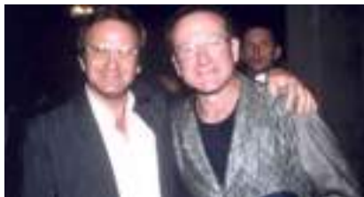
SOSIE ROBIN WILLIAMS