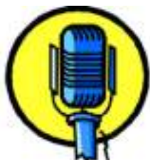
Présentateur Animateur Radio : la vie en direct!