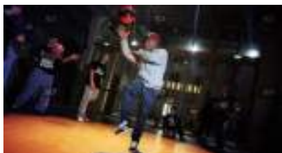
Basket Freestyle : le jeu de ballon qui se démarque!