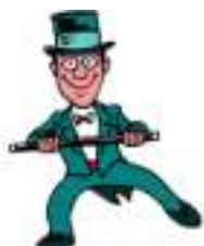
Présentateur Showbiz et Spectacle : ami des Stars ou Star entre amis