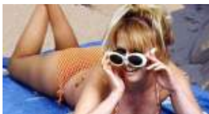
SOSIE BRIGITTE BARDOT