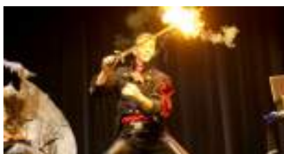
SPECTACLE MAGIE PRESTIGE