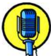
Présentateur Animateur Radio : la vie en direct!