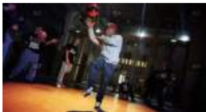
Basket Freestyle : le jeu de ballon qui se démarque!