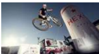
VTT Trial : le spectacle de vélo qui colle à la roue !