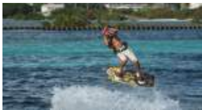
Kitesurf ou Kiteboard : la démonstration de surf tracté qui vous tire vers le haut !