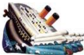
TOBOGGAN TITANIC GONFLABLE