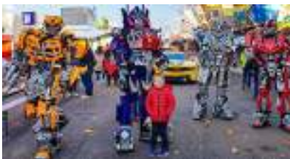
Les ROBOTS EXTRATERRESTRES PERFORMERS du Futur