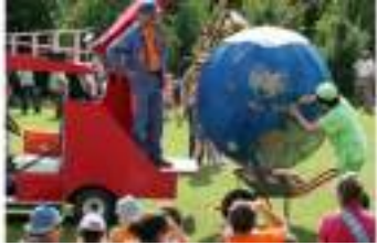
POINT D'EAU Planète Terre