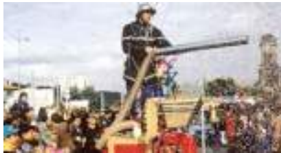
CHAR DES POMPIERS CONFETTIS