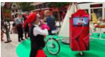
LE MANEGE PIRATE à PEDALES : ECOLO MUSICAL et CREATIF