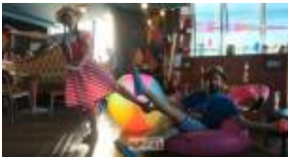
BORD DE MER : Artistes Glaces à l'Eau pour Vacanciers Estivaux très Beaux !