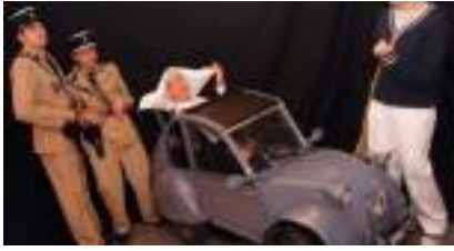
LES GENDARMES de SAINT-TROPEZ et la Mini Deudeuche !