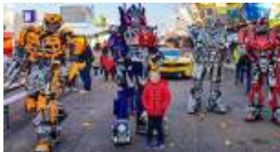
Les ROBOTS EXTRATERRESTRES PERFORMERS du Futur