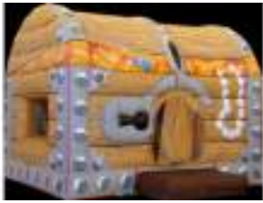
LE COFFRE AU TRESOR DES PIRATES