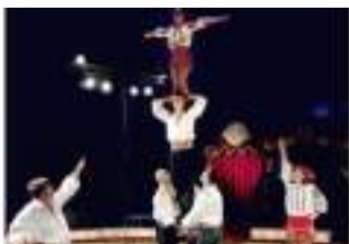
LA GRANDE BASCULE MOLDAVE