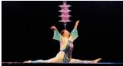
VERRES EN EQUILIBRE