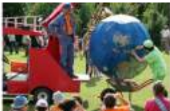
POINT D'EAU Planète Terre