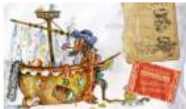
LES METIERS DE LA PIRATERIE Commerçants des Océans