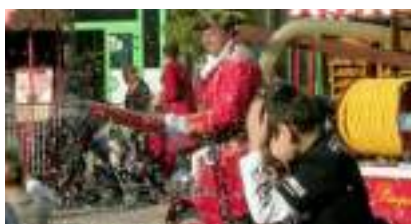
Le CHAR des PIRATES avec CANON CONFETTIS : les Pompiers Corsaires !