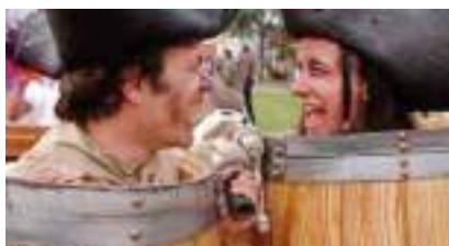
LES BARRIQUES PIRATES : Sketches bien Tassés à Boire au fil de l'Eau