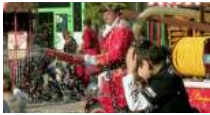
Le CHAR des PIRATES avec CANON CONFETTIS : les Pompiers Corsaires !