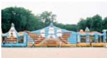
L'ÎLE AUX PIRATES GONFLABLE