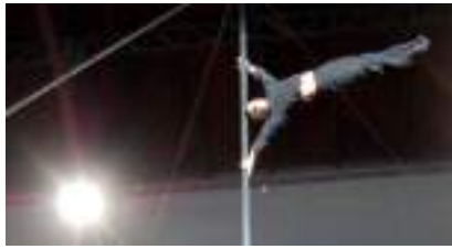
LES GARS DU MÂT CHINOIS