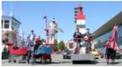
Le PHARE MOBILE : flots de Jazz pour chants de Marins et Mouettes !