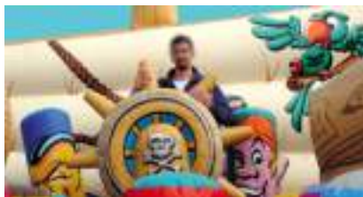
LES PIRATES DES CARAIBES