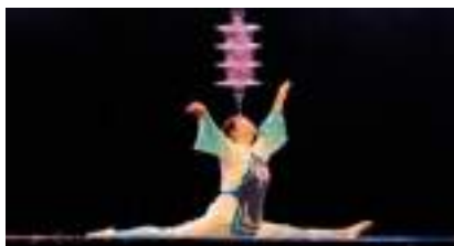
VERRES EN EQUILIBRE