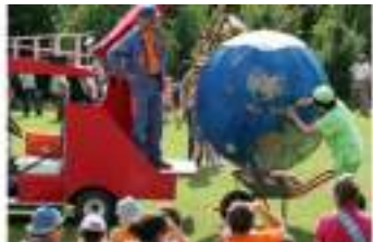
POINT D'EAU Planète Terre