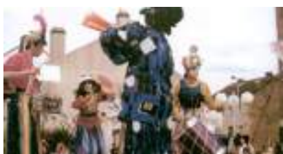
LES ECHASSIERS MUSICIENS : le théâtre des géants de la rue