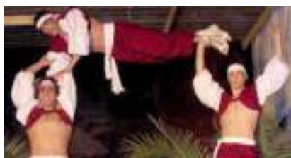
ACROBATIE EQUILIBRE ET PYRAMIDES