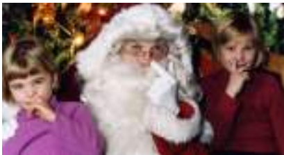
Le Père Noël Amuseur, Acteur et Présentateur !