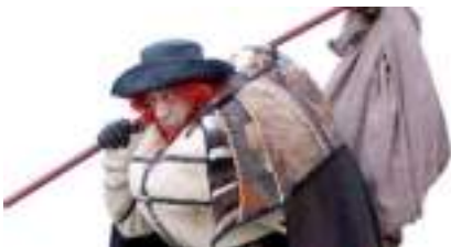
LE PERE FOUETTARD de NOËL et la SAINT-NICOLAS avec ses lutins sur échasses