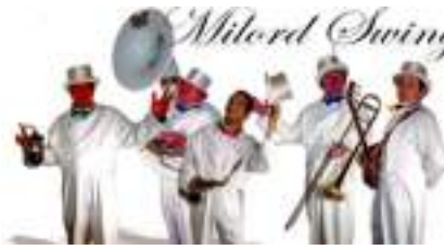
SWING en SMOKING pour NUIT BLANCHE : JAZZ MILORD