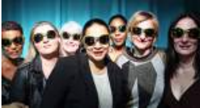
ANIMATION BORNE PHOTOCALL VINTAGE DISCO PHOTOBOOTH SUR FOND VERT