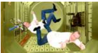
STUDIO PHOTO SCIENCE FICTION FX EFFETS SPECIAUX

Source URL: https://www.monicamedias.com/animation-photo-disco-shooting-nightclub-studio-photocall-discotheque.html