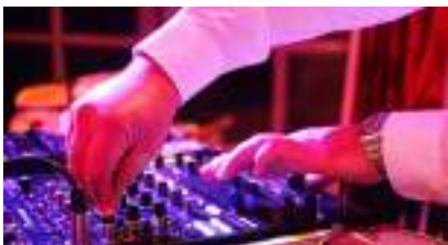
Dj sonorisé PRO pour fête dansante DISC JOCKEY international pour soirée entreprise