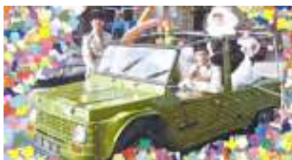
SAINT TROPEZ GENDARMES PARTY