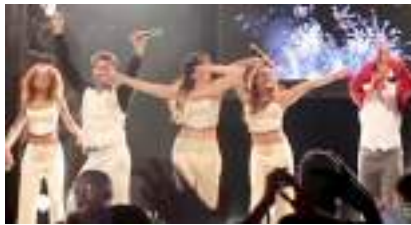
SOIREE DISCO FUNKY HITS