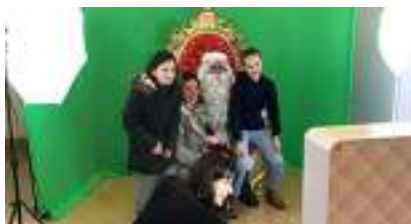
ANIMATION BORNE PHOTO PERE NOËL : Stand Photobooth sur Fond Vert

Source URL: https://www.monicamedias.com/animation-photo-disco-shooting-nightclub-studio-photocall-discotheque.html