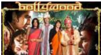
STUDIO PHOTO BOLLYWOOD INDE INDIA