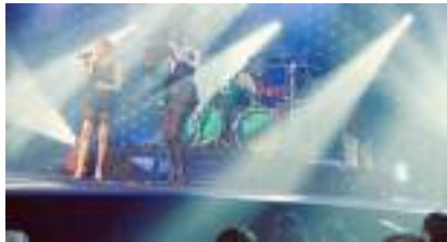
L'Orchestre Live de vos Evénements Pros : ORCHESTRAL SHOW