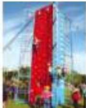
TOUR ESCALADE AVENTURE TYROLIENNE