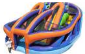
LE COMBO GONFLABLE de l'Ultime Parcours