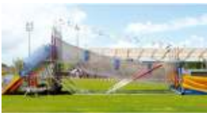
PARCOURS KIDS AVENTURE ESCALADE ET TYROLIENNE