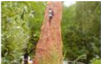
MUR MENHIR D'ESCALADE pour Initiation à la Grimpe