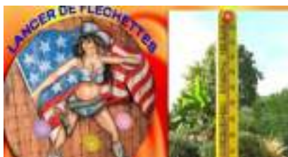
JEUX FORAINS : la JOURNEE des DEFIS !