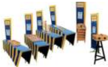
TOURNOLJEUX en BOIS PRESTIGE