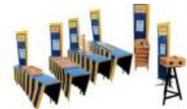
TOURNOI JEUX en BOIS PRESTIGE