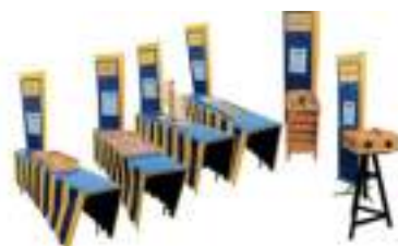
TOURNOI JEUX en BOIS PRESTIGE