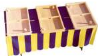
TABLE A ELASTIQUE