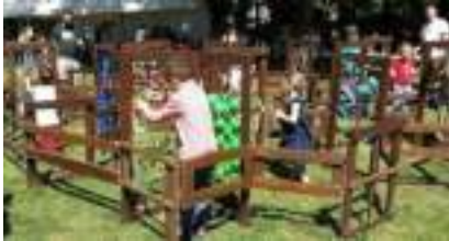
LABYRINTHE en BOIS Géant Grandeur Nature : le Dédale Sensoriel Pédagogique