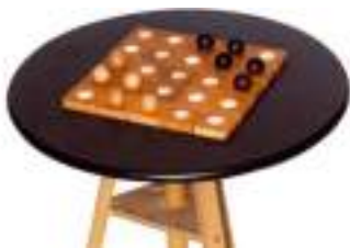
QUITO CASSE-TETE STRATEGIE