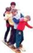
PLANCHES A SKI