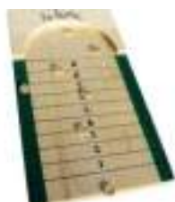
TUNE ET JETONS