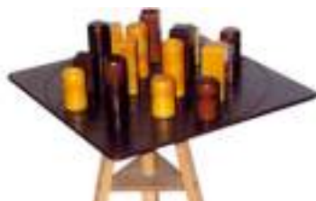
QUARTO CASSE-TETE STRATEGIE