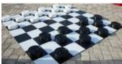
JEUX GEANTS Dames Mikado Puissance 4 : Stratégie et Adresse !