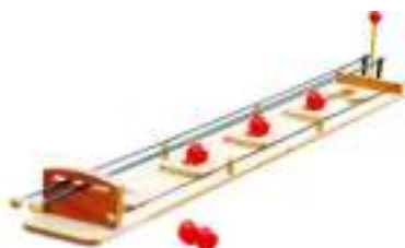
TWISTO ET BOULES