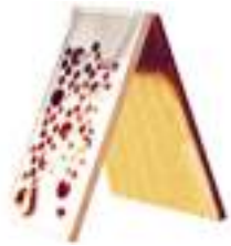
GRUYERE ET TROUS