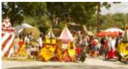
Le Petit Camp Médiéval des Beaux Jeux : LE VILLAGE DES CHERUBINS